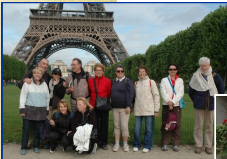
Le groupe de confrères

"On ne peut asservir un homme qui marche" a dit Henri Vincenot. Chacun a pu prendre conscience que cette citation pouvait également s'appliquer dans notre capitale qui mérite mieux qu'un simple survol nécessitant alors des conditions qui respectent l'individu et lui donnent ainsi les moyens de vivre en éveil.