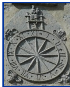
Cadran de l'église