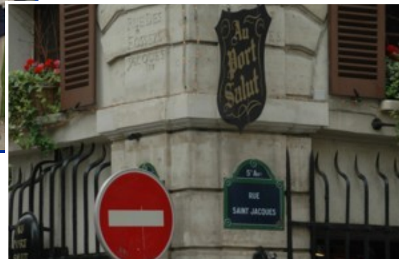
La rue Saint Jacques