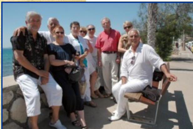
Le plaisir de se retrouver entre confrères

Cette mise en place devrait favoriser le développement d'une province constituée de nombreux pèlerins à qui la Confrérie souhaite apporter une aide active dans le cadre d'une démarche spirituelle qui est sa raison d'être.