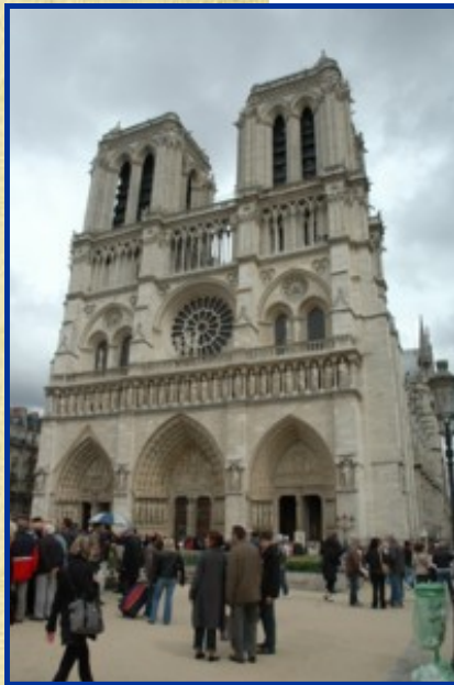
Une visite à Notre-Dame