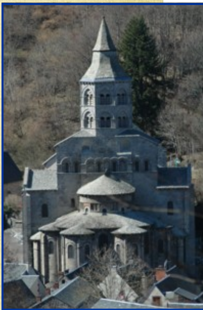
Le chevet de l'église d'Orcival

Le 21 mars 2009, jour de l'équinoxe de Printemps, la confrérie d'Auvergne a organisé une marche vers Orcival pour visiter sa magnifique église romane. Les confrères auvergnats prennent ainsi chaque mois le temps d'une marche pour se ressourcer dans des hauts lieux du patrimoine régional et associer ainsi démarche spirituelle et culturelle dans un beau moment de fraternité.