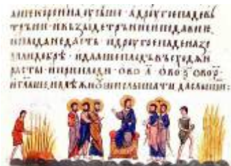
Enluminure du XII e siècle « La parabole du Semeur »

Le Bonheur commence lorsqu'on décide d'en donner