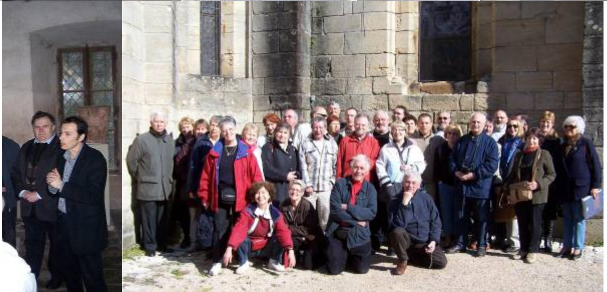
Notre groupe de joyeux confrères - Vues de Conques et Estaing